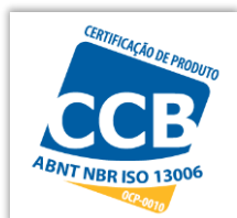
CERTIFICAÇÃO DE PRODUTO