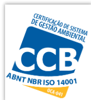
CERTIFICAÇÃO DE SISTEMA