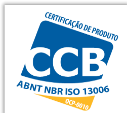
CERTIFICAÇÃO DE PRODUTO